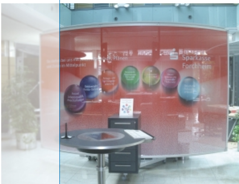
Diskretionswände: Plakativ, mobil und kostengünstig.