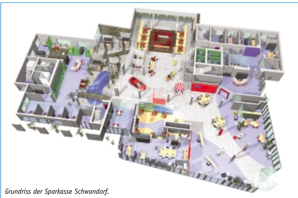
Grundriss der Sparkasse Schwandorf.

Die Sparkasse als Impulsgeber zur Wiederbelebung der Innenstadt: Grundgedanke der Gesamtstrategie war der Zusammenschluss mehrerer