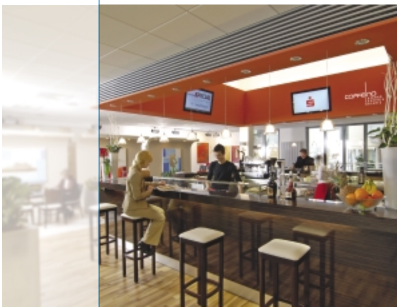
COFFEINO – Cafabar – Creperie – Galerie